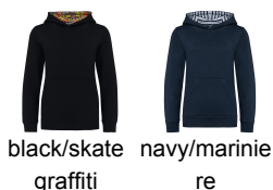
black/skate graffiti navy/marinie re